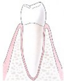
Dwarsdoorsnede van een kies met wortel

Na 3 tot 6 maanden kan uw tandarts een kroon plaatsen op het implantaat.