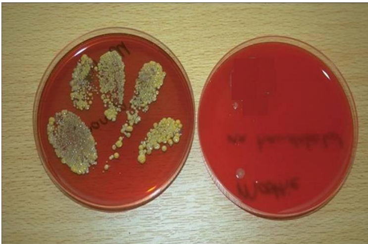
Kweek voor en na handen desinfecteren.