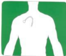
2. Plaats van de port in het lichaam

Via de port-a-cath kunnen medicijnen, bepaalde voeding en bloedtransfusies rechtstreeks in het bloed toegediend worden. Ook kan eventueel bloed voor laboratoriumonderzoek via de port worden afgenomen. U krijgt de port-a-cath wanneer u bepaalde medicijnen moet krijgen die niet via een gewoon infuus gegeven kunnen worden. Of wanneer het moeilijk is een infuus te prikken bij u omdat de bloedvaten diep liggen of erg broos zijn. Bloedafname vindt plaats als het bloedprikken op het laboratorium erg moeizaam gaat.