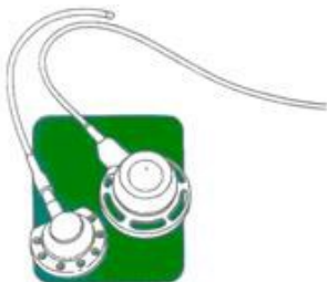
1. De port-a-cath

De port bestaat uit twee delen: een katheter van siliconen (een soort rubber) en een injectiekamer (port) gemaakt van chirurgisch staal en/of kunststof, van boven afgesloten door een zelfsluitend siliconen membraan (zie tekening 1). De materialen waarvan de port-a-cath is gemaakt kunnen zonder probleem langere tijd in het lichaam aanwezig zijn. De katheter wordt ingebracht in een groot bloedvat in de hals over het sleutelbeen of vanuit de richting van de schouder onder het sleutelbeen en de tip komt dichtbij het hart te liggen. De injectiekamer wordt meestal aan de bovenzijde van de borst, onder het sleutelbeen geplaatst (tekening 2). De injectiekamer ligt onder de huid en is te voelen als een zwelling.