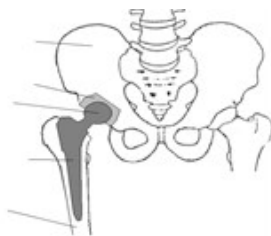
Bouw van het heupgewricht