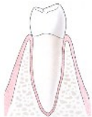
Dwarsdoorsnede van een kies met wortel

Na 3 tot 6 maanden kan uw tandarts een kroon plaatsen op het implantaat.