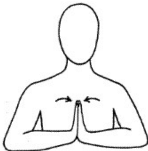
Handen tegen elkaar drukken

9. Druk uw handen voor uw borst volledig tegen elkaar aan.